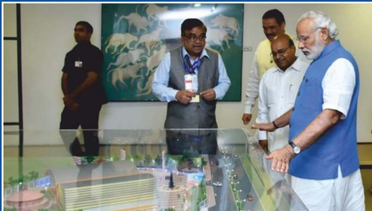
Hon'ble Prime Minister watching the model of Dr. Ambedkar Memorial which is being set up at 26, Alipur Road, Delhi.

The Hon'ble Prime Minister laid the foundation stone of Dr. Ambedkar National Memorial, 26, Alipur Road, Delhi and delivered 6th Dr. Ambedkar Memorial Lecture on 21 st March, 2016 in the presence of the Hon'ble Minister (SJ&E) and Hon'ble Minister (S&T and Earth Sciences) at a function held at Vigyan Bhawan, New Delhi. The address of the Hon'ble Prime Minister is at Page No. 47.