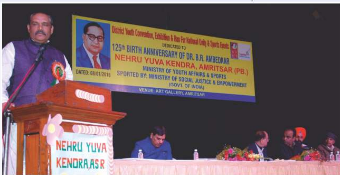
Hon'ble Minister of State for Social Justice and Empowerment Shri Vijay Sampla at the function organized by Nehru Yuva Kendra Sangthan at Amritsar on 08.01.2016