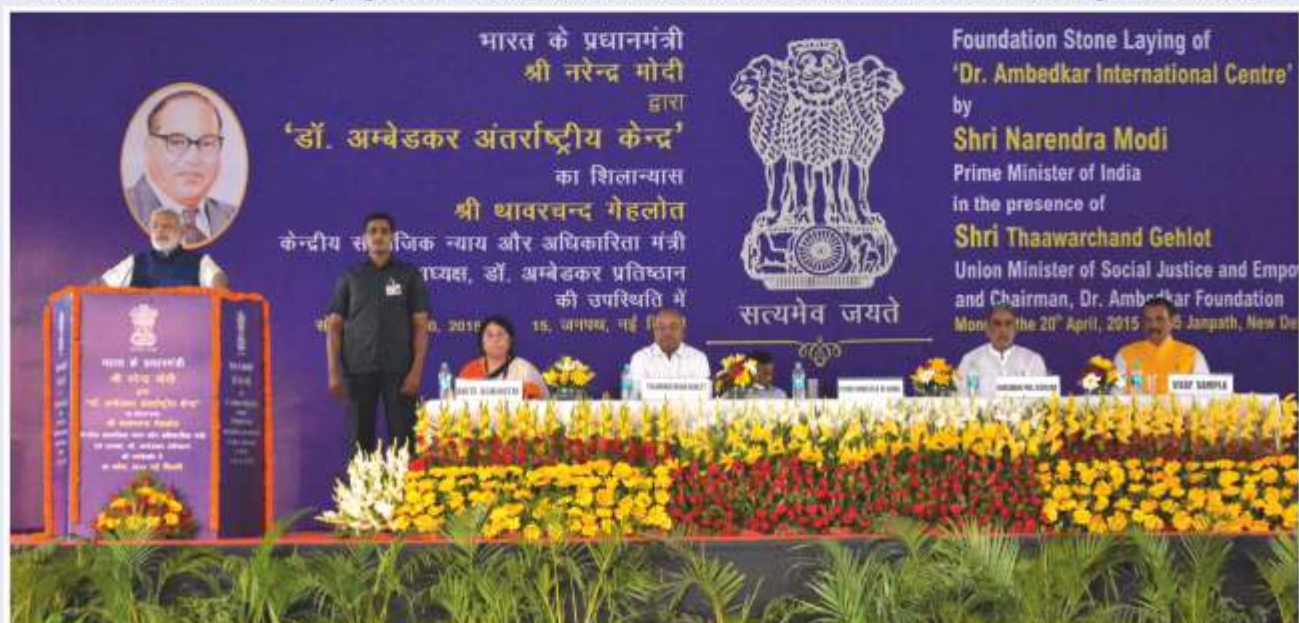
Hon'ble Prime Minister's Addressing the gathering after foundation stone laying ceremony of Dr. Ambedkar International Centre, 15, Janpath, New Delhi