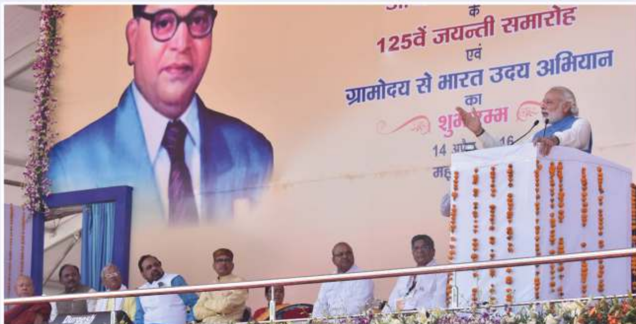
Hon'ble Prime Minister addressing all Gram Sabhas on April 24, 2016.

On 24 th April 2016, Hon'ble Prime Minister addressed Gram Sabhas all over the country, which was telecast and aired live. People gathered in villages across the country to hear the Prime Minister's address.