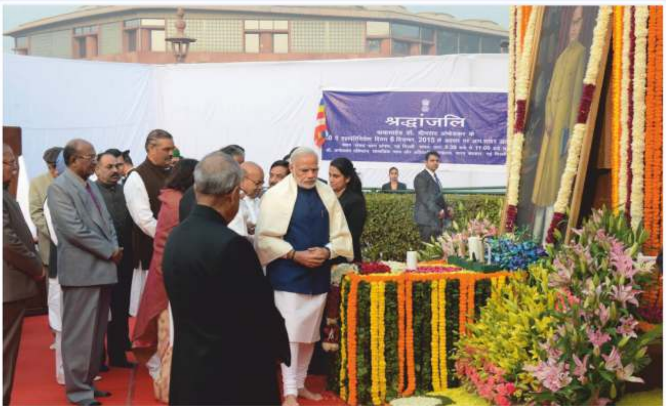
Hon'ble Prime Minister offering floral tributes to Dr. Ambedkar in the Parliament House Complex