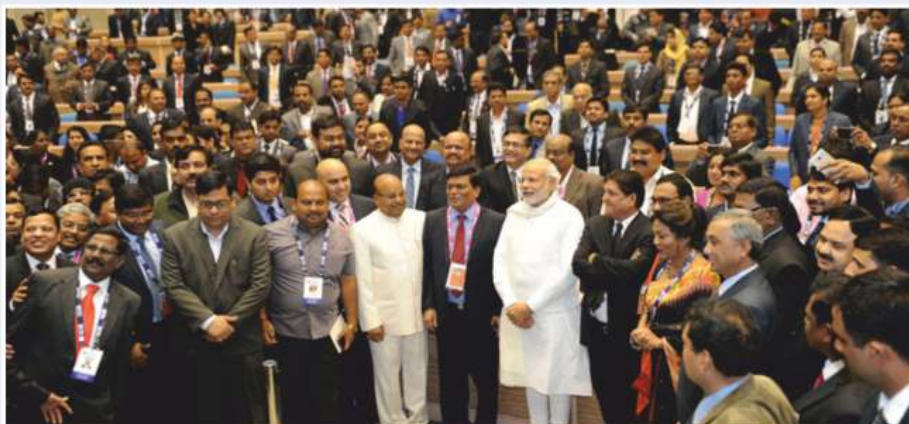
Hon'ble Prime Minister with the gathering during the National Conference on Ideas and Thoughts of Dr. Ambedkar on 'Industrialization and Entrepreneurship'

Full text of the speech delivered by Hon'ble Prime Minister during the occasion is at page No. 44.