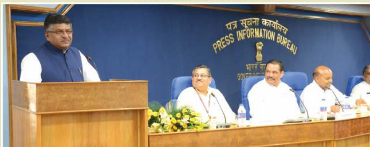
Hon'ble Minister of Communication and Information Technology Shri Ravi Shankar Prasad addressing the gathering after release of the commemorative stamp on Dr. B. R. Ambedkar