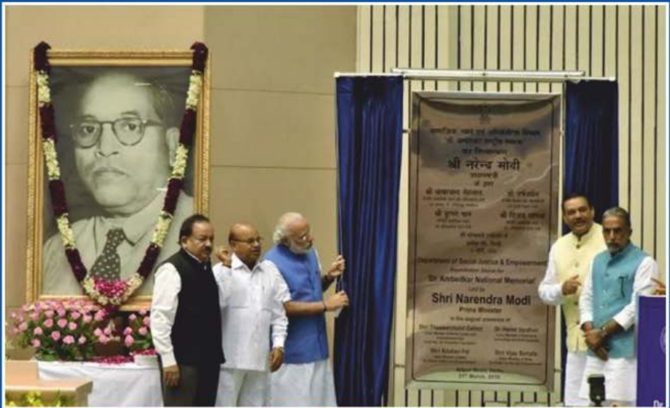
Hon'ble Prime Minister laying the foundation stone of Dr. Ambedkar Memorial at a function in Vigyan Bhawan, New Delhi.