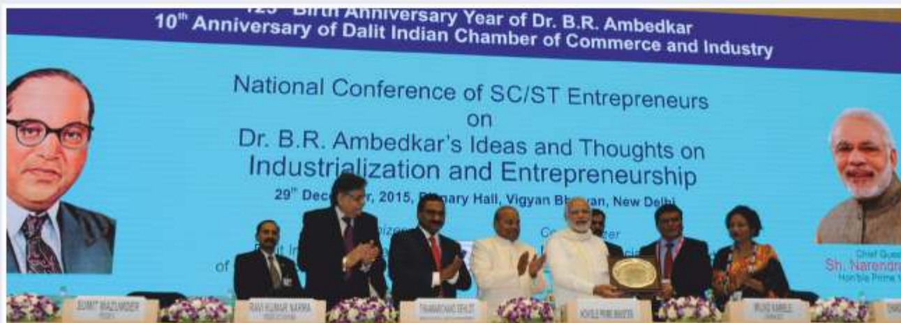
Hon'ble Prime Minister Inaugurates National Conference of Dalit Entrepreneurs