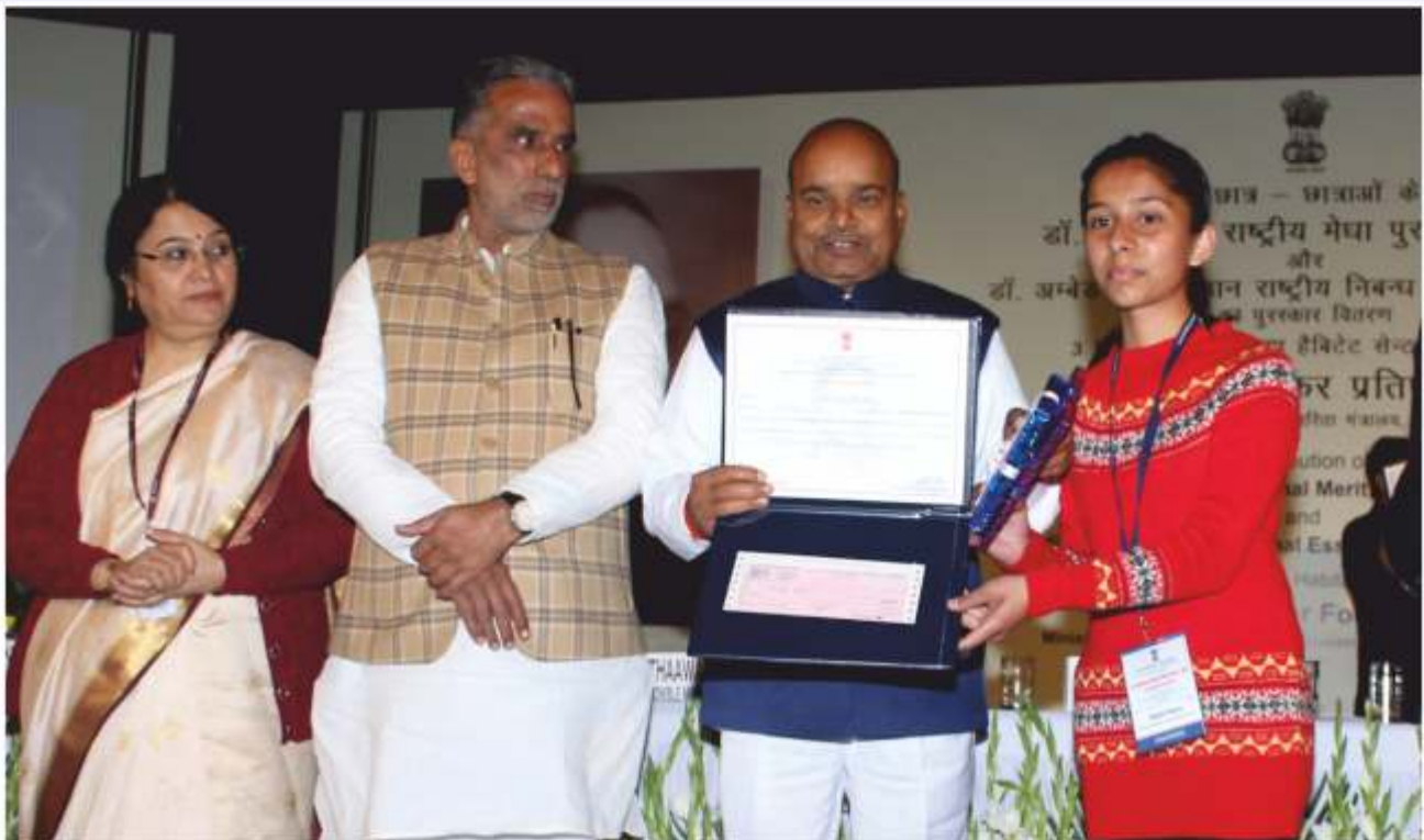
Presentation of Dr. Ambedkar merit awards to Secondary and Senior Secondary Class Students

Dr. Ambedkar Foundation National Essay Competition is a part of the year long celebrations and the identified activities of the 125 th Birth Anniversary year of Dr. B.R. Ambedkar, the Hon'ble Minister of Social Justice and Empowerment awarded the winners of the Dr. Ambedkar Foundation National Essay Competition, presented Dr. Ambedkar merit awards to Secondary and Senior Secondary Class Students