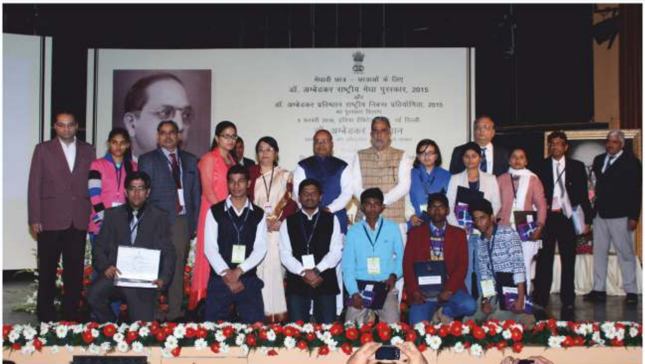
Winners of the Dr. Ambedkar merit awards to Secondary and Senior Secondary Class Students with the Hon'ble Ministers