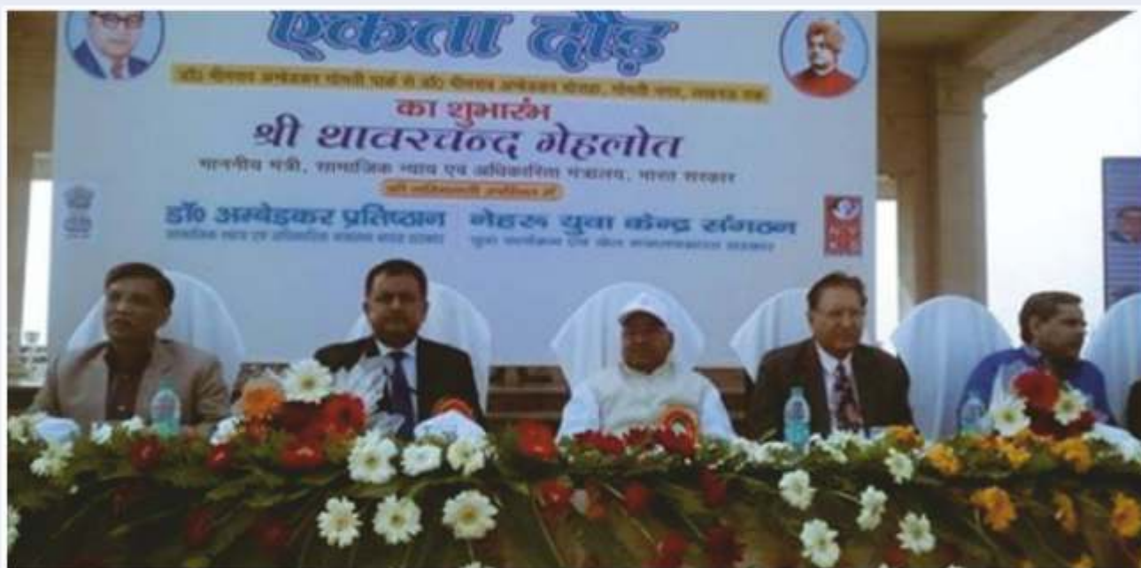
Hon'ble Minister of Social Justice and Empowerment Shri Thavarchand Gehlot at the 'Run for Unity' in Lucknow on the occasion of Nationwide Celebration of 125 th Birth Anniversary of Dr. B. R. Ambedkar

As a part of the yearlong celebrations one of the identified activities of the 125 th Birth Anniversary year of Dr. B.R. Ambedkar, was a programme of the 'Youth Run for the National Unity'. This work was entrusted to Nehru Yuva Kendra Sangthan, Ministry of Youth Affairs and Sports. Dr. Ambedkar Foundation has released an amount of ₹172.00 lakhs to the Nehru Yuva Kendra for this programme. The programme was organized at all State/Union Territory Capitals and also at important Cities in the country. A total of 125 such programmes were organized.