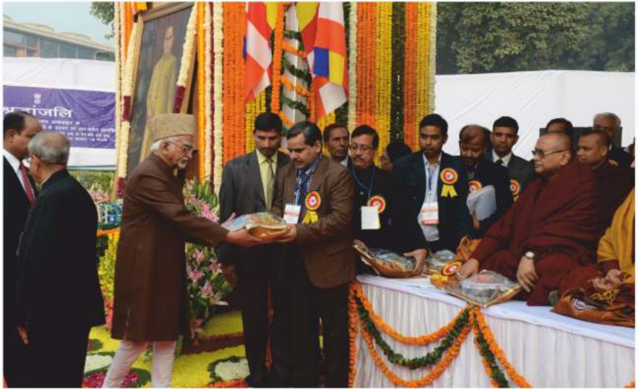
Hon'ble Vice-President offering gifts to Buddhist Monks on the Parinirvan Divas of Dr. Ambedkar