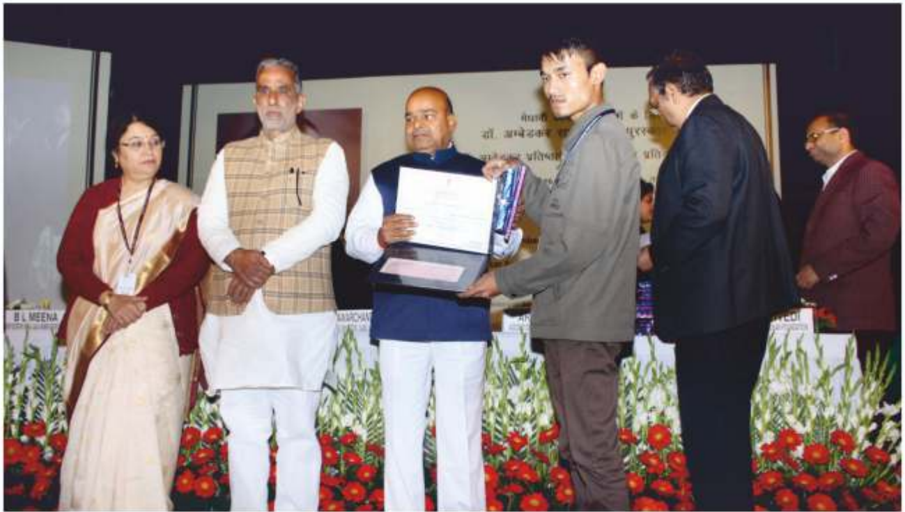
Presentation of Dr. Ambedkar merit awards to Secondary and Senior Secondary Class Students

and released Audio Book (CDs) of Collected Works of Babasaheb Ambedkar (CWBA) on 03.02.2016 in a function held at India Habitat Centre, New Delhi Only six hundred and seventeen students belonging to SC/ST category who scored maximum marks in different state/central board of school education were felicitated during the function.