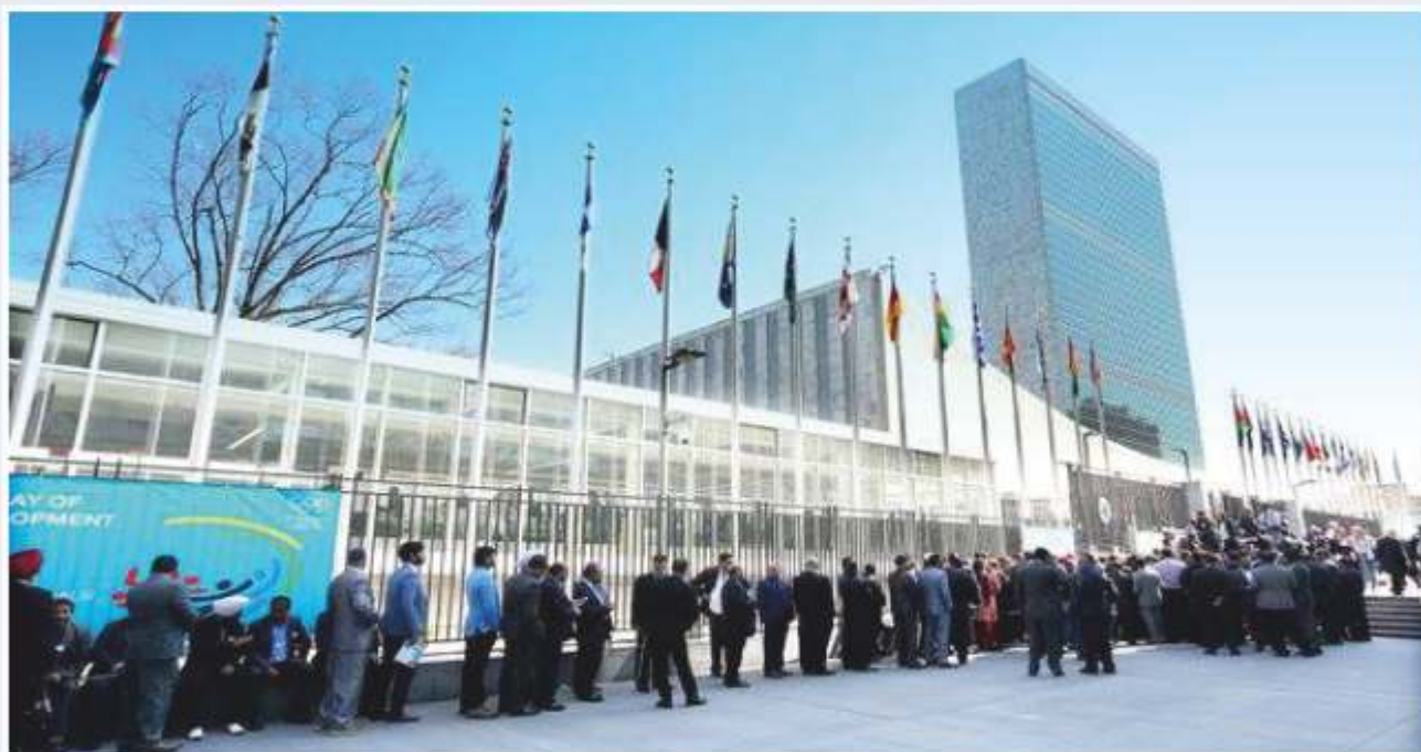
125 th Birth Anniversary celebration of Dr. B. R. Ambedkar at UN Head Quarters