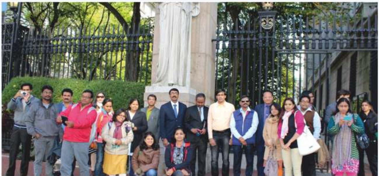
Research scholars at Columbia University, USA

Almost all the participants in the study tour had submitted their own reports and reminiscences about their visit to the LSE and the Columbia University. Due to constraint of space, it is regretted that the same has not been included as a part of this compendium.