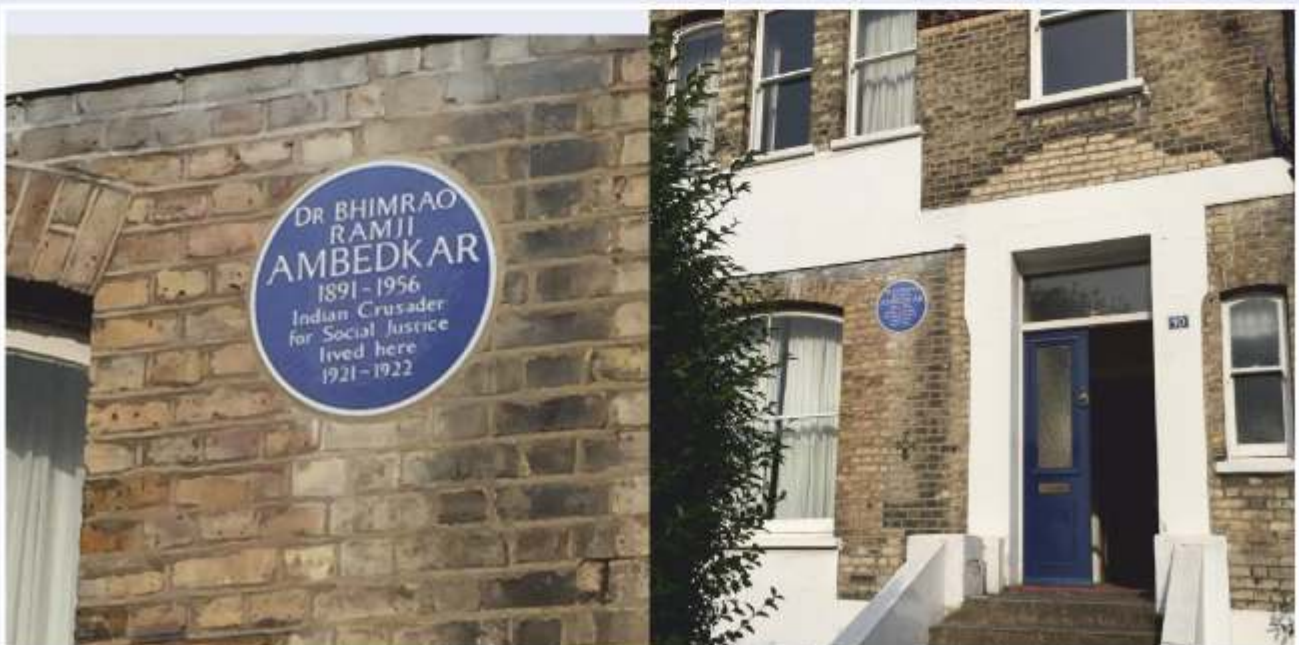
10, King's Henry Road, London where Dr. B. R. Ambedkar lived during his higher studies.