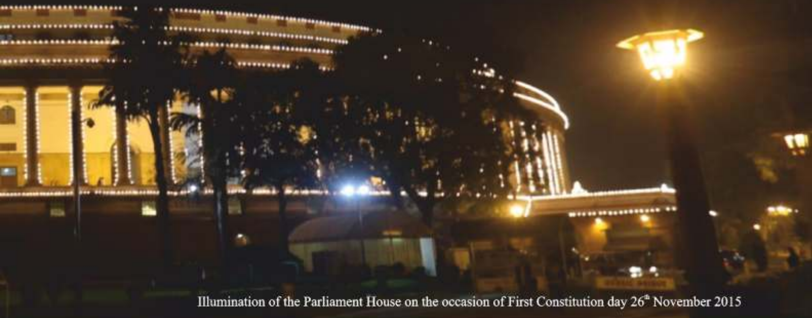
Illumination of the Parliament House on the occasion of First Constitution day 26 th November 2015

Government of Himachal Pradesh celebrated the Constitution Day by reading out the Preamble of the Constitution in all the State Government offices and in all the educational institutions throughout the State.