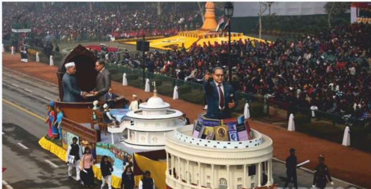
The tableau at Rajpath on the Republic Day Parade on 26.01.2016

As a part of the yearlong celebrations and one of the identified activities of the 125 th Birth Anniversary year of Dr. B.R. Ambedkar the Ministry of Social Justice and Empowerment displayed a tableau on Dr. B. R. Ambedkar in the Republic day Parade i.e. 26 th January, 2016 at Rajpath, India Gate, New Delhi.