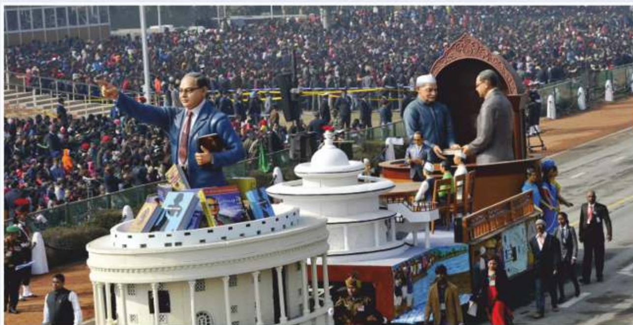
The tableau at Rajpath on the Republic Day Parade on 26.01.2016