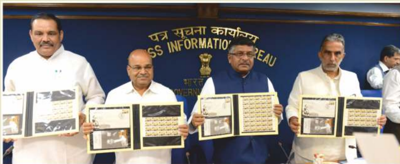
Release of Commemorative Postal Stamp on Dr. B.R. Ambedkar