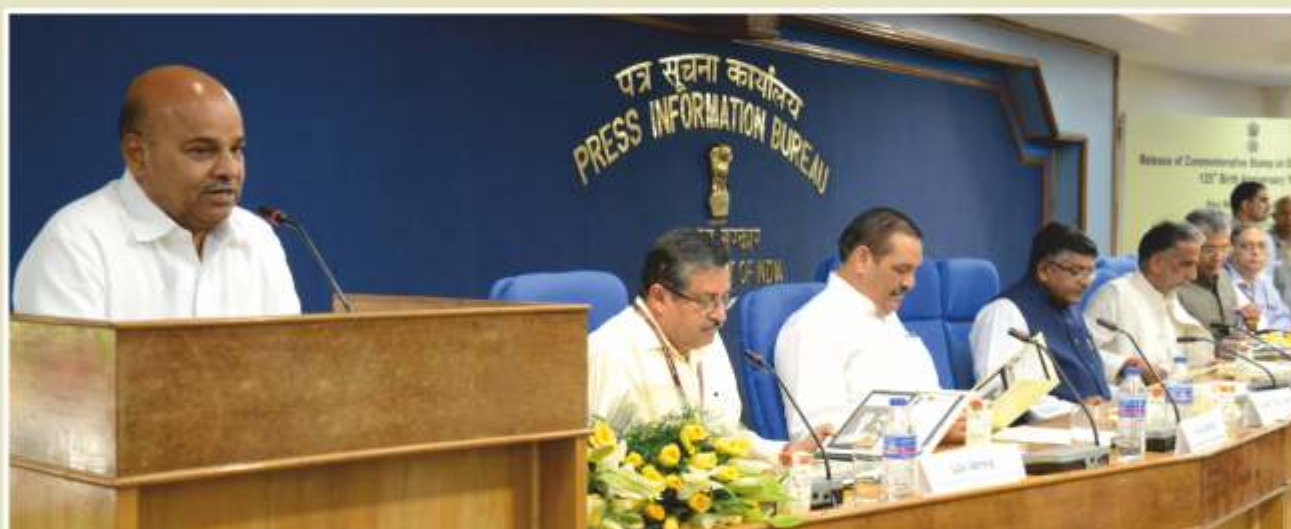
Hon'ble Minister of Social Justice and Empowerment addressing the gathering on the occasion of release of commemorative stamp on Dr. B. R. Ambedkar.