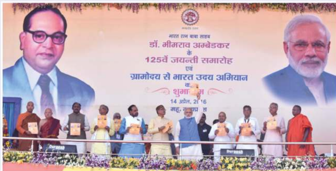
Hon'ble Prime Minister inaugurating the Gram Uday Se Bharat Uday Abhiyan on April 24, 2016.

Events were held in all Gram Panchayats during this campaign, as well as at the National level. The main programmes that were held during this campaign are: