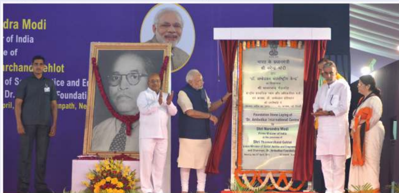
Hon'ble Prime Minister's laying the foundation stone of Dr. Ambedkar International Centre, 15, Janpath, New Delhi

Hon'ble Prime Minister, Shri Narendra Modi laid the foundation stone of Dr. Ambedkar International Centre on 20 th April 2015 in the presence of Shri Thaawarchand Gehlot, Minister of Social Justice and Empowerment and Chairman, Dr. Ambedkar Foundation, Shri Krishan Pal Gurjar and Shri Vijay Sampla, Ministers of State for Social Justice and Empowerment.