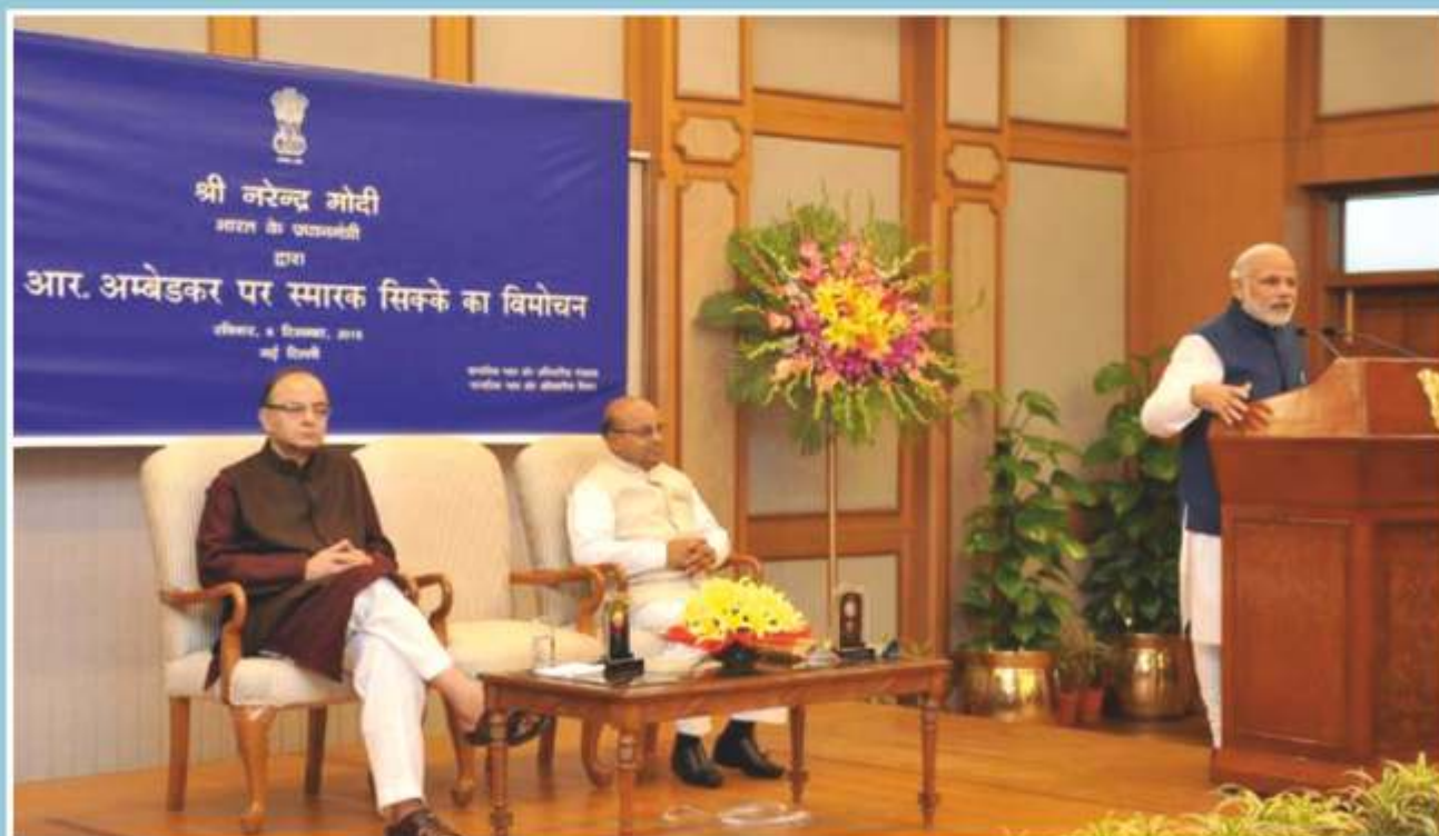
Hon'ble Prime Minister addressing the gathering after release of the Commemorative Coins on Dr. B. R. Ambedkar

Full text of the address of the Hon'ble Prime Minister is at page No. 41.