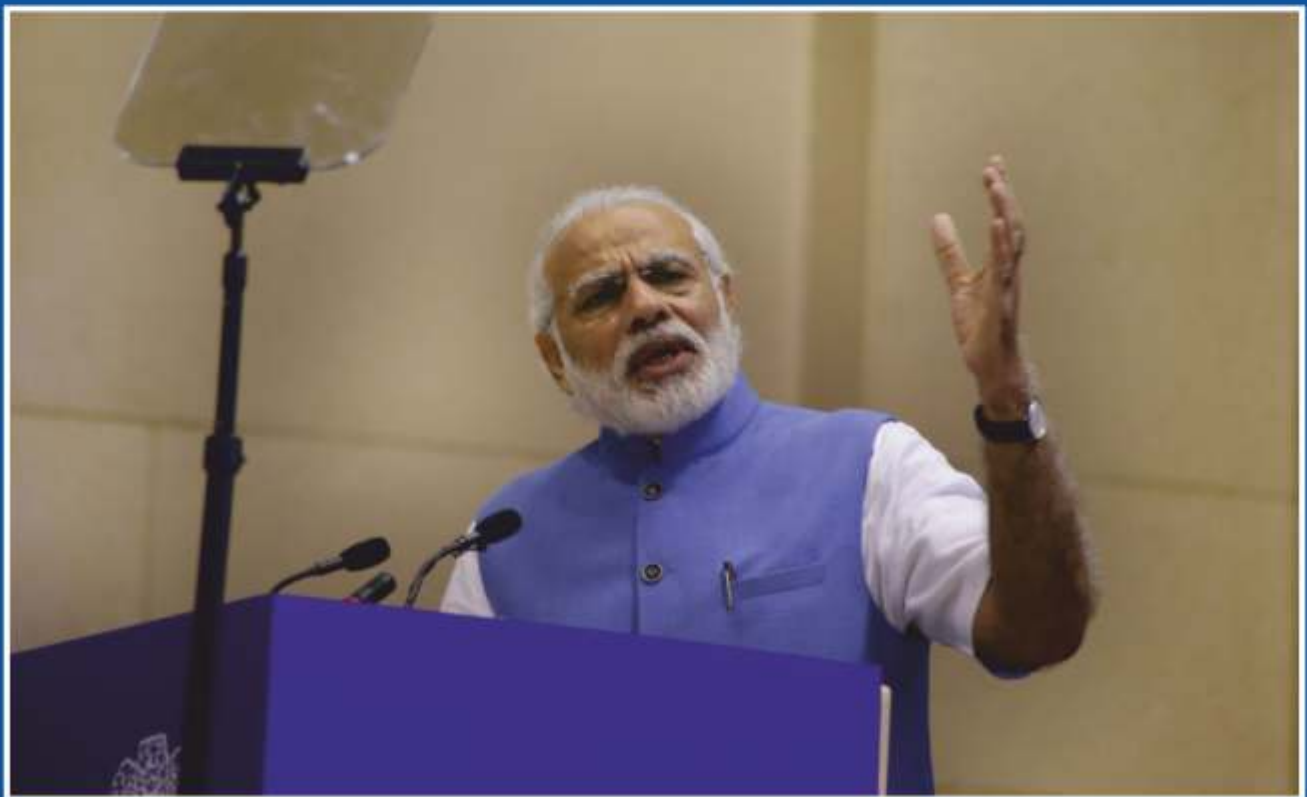
Hon'ble Prime Minister addressing at Dr. Ambedkar Memorial at a function in Vigyan Bhawan, New Delhi.