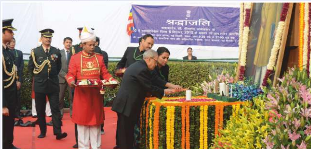
Hon'ble President offering floral tribute to Dr. B. R. Ambedkar

The 60 th Mahaparinirvan Diwas of Dr. B.R. Ambedkar was observed on 6 th December, 2015 in the Parliament House Lawns. The President of India led the nation in paying floral tributes to Dr. B.R. Ambedkar. The Vice President, Prime Minister, Minister of Social Justice and Empowerment & Chairman (DAF) also paid floral tributes to Dr. Ambedkar. Prominent leaders of political parties and a large number of general public also joined them on the occasion.