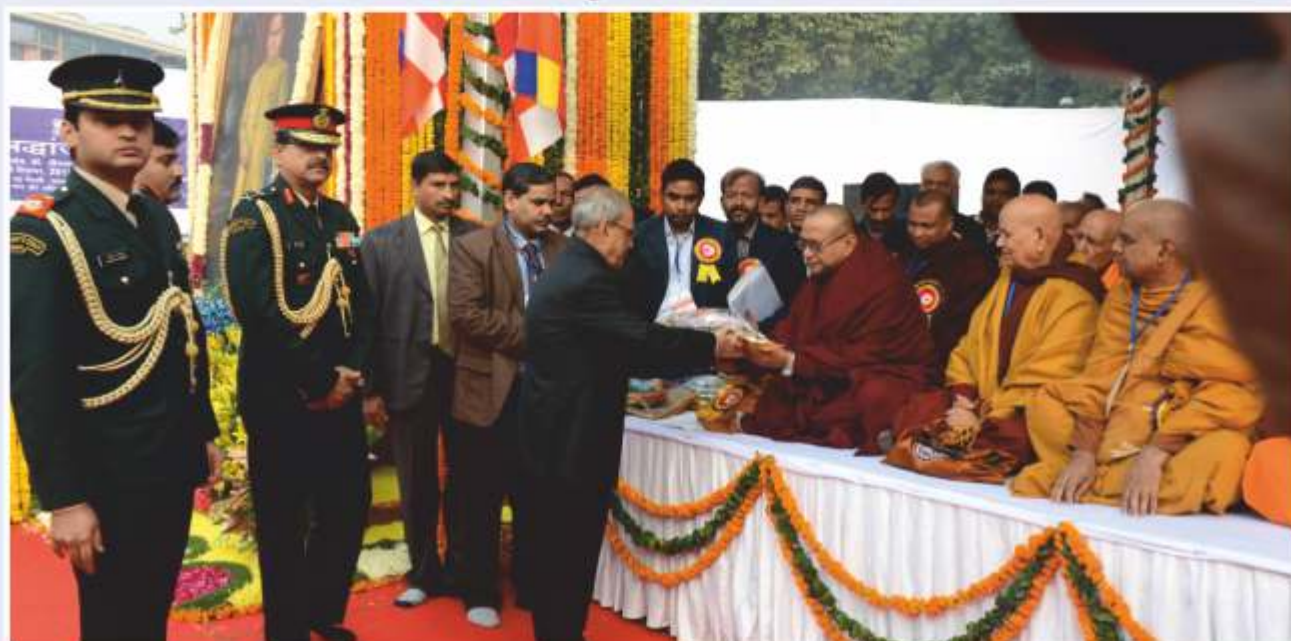
Hon'ble President offering gifts to Buddhist Monks on the Parinirvan Divas of Dr. Ambedkar