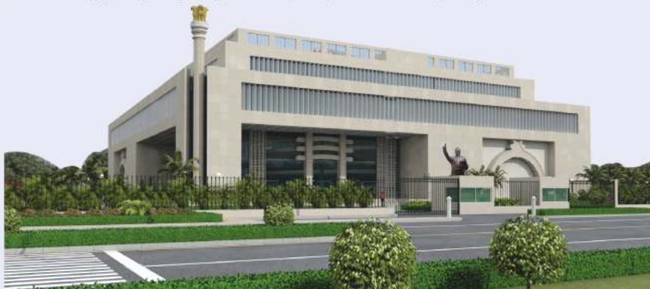
Approved architectural design of 'Dr. Ambedkar International Centre'

Dr. Ambedkar's vision of fraternity finds its eloquent expression in the environment friendliness features of the building by integrating energy efficient principles in the building design.