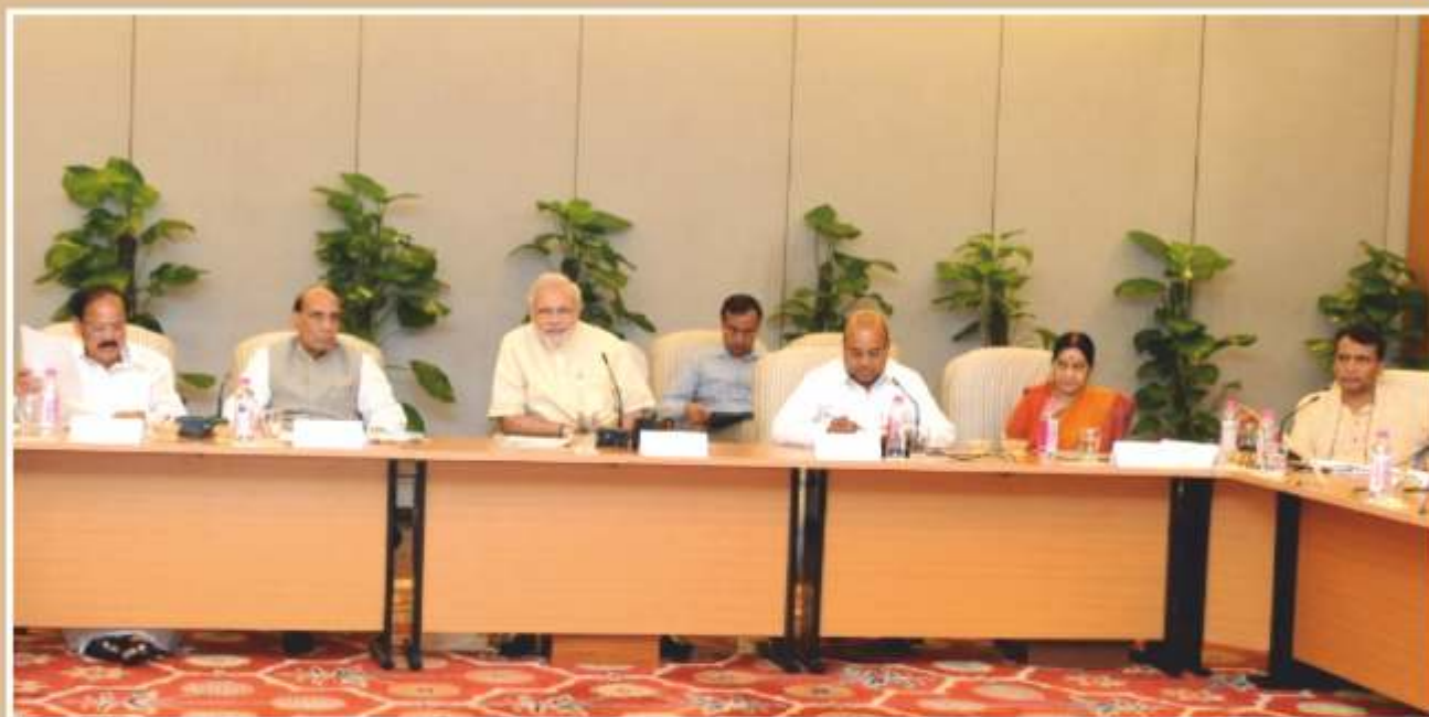
Meeting of the National Committee under the Chairmanship of Hon'ble Prime Minister

The first meeting of the National Committee on Nationwide Celebration of 125 th birth anniversary of Dr. B. R. Ambedkar was held on 23.07.2015 at 7, Race Course Road (RCR), New Delhi under the chairmanship of the Hon'ble Prime Minister for administration and guidance to the nation-wide celebration of 125 th Birth anniversary year of Babasaheb Dr. Ambedkar. The meeting was attended by all the members of the National Committee. Copy of the Minutes of the meeting is at page No. 36.