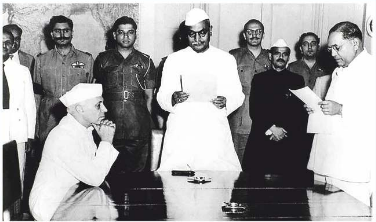
Dr. B R Ambedkar as First Law Minister of India – swearing in ceremony

In the year 1907, young Bhimrao passed the Matriculation examination from Bombay University with flying colours. Later in 1913 he graduated in Political Science and Economics from Bombay University. Around the same time his father passed away. Although he was going through a bad time, Bhimrao decided to accept the opportunity to go to USA for further studies at Columbia University for which he was awarded a scholarship by the Maharaja of Baroda. Bhimrao remained abroad from 1913 to 1917 and again from 1920 to 1923. During this period he had established himself as an eminent intellectual. Columbia University had awarded him the Ph.D for his thesis, which was later published in a book form under the title "The Evolution of Provincial Finance in British India". However his first published article was "Castes in India - Their Mechanism, Genesis and Development". During his stay in London from 1920 to 1923, he also completed his thesis titled "The Problem of the Rupee" for which he was awarded the degree of D.Sc.